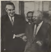
Riba e promer grafica Averell Harriman (robos) ta wordé saluda door di Valerian A. Zorin un su yegada na Moscu. Riba e otro Harriman (robos), e embahador mericano Foy Kohler (mei-mei) y Nilita Krutches a reuni pa un sesion.